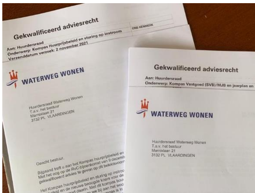
Onderwerpen waarover de Huurdersraad gevraagd advies gaf aan Waterweg Wonen