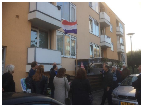
Werkbezoek van bestuursleden Huurdersraad, leden RvC en medewerkers Waterweg Wonen aan MUWI-1