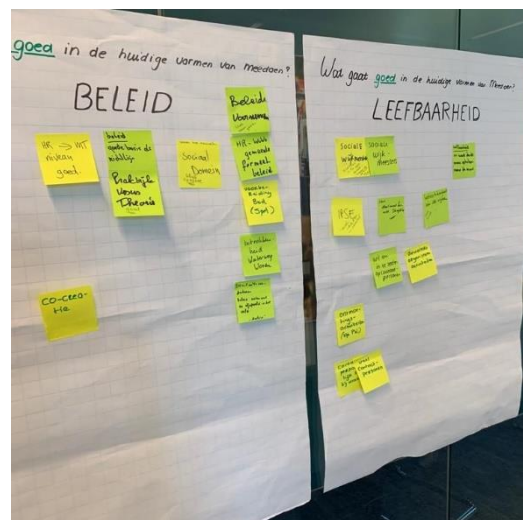
Tijdens de bespreking van het onderzoek 'Meedoen met Huurders'