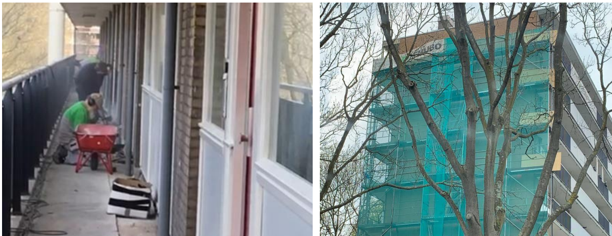
Bestuursleden van de Huurdersraad gingen langs bij wooncomplexen met zwakke uitkragende galerijen