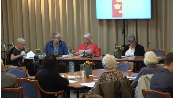
Impressie van de ALV van 13 oktober 2021